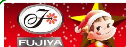
クリスマス(放映時間帯の8時、9時、24時以外の回に放映)