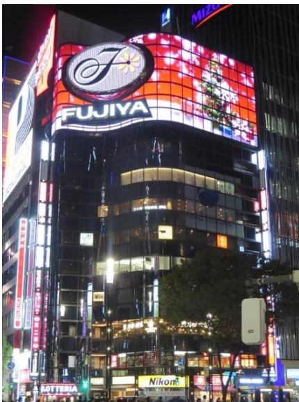
ペコちゃんビジョンクリスマスバージョン (昨年の様子)

2018年3月、不二家数寄屋橋店(1953年・昭和28年開店)が入居するビル屋上の不二家広告塔を、1982年(昭和57年)以来36年ぶりにリニューアルし、「ペコちゃんビジョン」が誕生しました。映像での多様な表現が可能になり、季節に合わせてさまざまなペコちゃんが期間限定で登場しています。