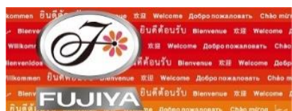
ウェルカム(8時、24時に放映)