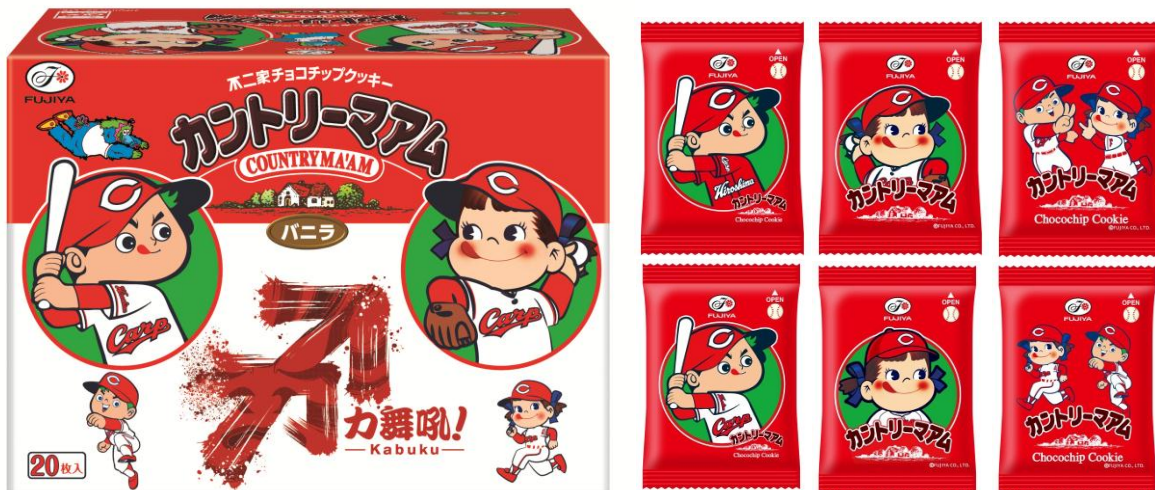
「カントリーマアム(ペコ&amp;カープ坊や)」パッケージ(左)と個包装デザイン(6種類)