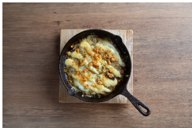
ザクザク焼きカレー