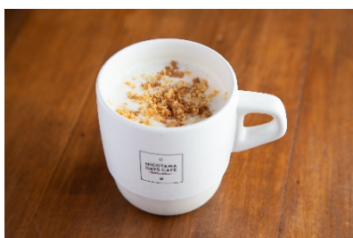
ホームパイチャイラテ（ホット）