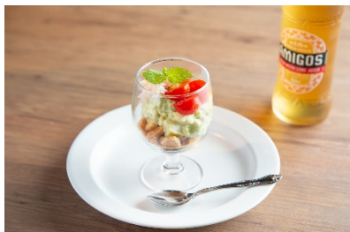
蟹とアボカドディップ

カフェの場を通じて、多くの皆様とホームパイとの出会いを作り、ホームパイの美味しさや商品に対するこだわりを体験してもらうことを目的に、「SHIORI」さん監修の「ホームパイアレンジメニュー」から4品を提供します。北欧風のキッチンをイメージした店内では、日常を忘れてゆったりとしたひと時を過ごしていただけます。また、ご自宅でも「ホームパイアレンジメニュー」をお愉しみいただけるように、レシピを記載したリーフレットを配布しています。