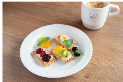
チーズクリームフルーツパイ