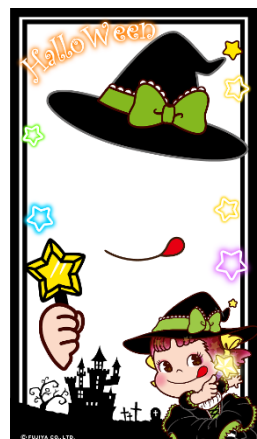
フォトフレームデザイン例▶

●フォトフレーム内容：3種類+GIFフォトフレーム(高速で3種のフレームが切り替わるようになっており、シャッターを押すタイミングにより、どのフォトフレームになるかが変わる設定)の、合計4種類の展開です。どのフォトフレームが出てくるかはお楽しみ！