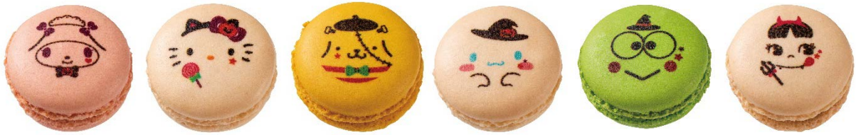
写真左より、マイメロディマカロン(フランボワーズ)/ハローキティマカロン(あまおう莓)/ポムポムプリンマカロン(レモン)/シナモロールマカロン(バニラ)/けろけろけろっぴマカロン(抹茶)/ペコちゃんマカロン(ショコラ) ©1976, 1988, 1996, 2001, 2018 SANRIO CO., LTD. APPROVAL NO. S591951 ※全てハロウィン限定バージョン