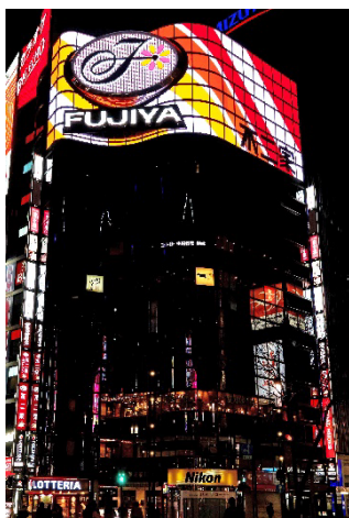
銀座クリスタルビル屋上 不二家広告塔

今年 3 月にリニューアルし LED ビジョン化した、不二家数寄屋橋店が入居する銀座クリスタルビル屋上の不二家広告塔。9 月 1 日（土）から 10 月 31 日（水）まで、魔女の仮装をしたペコちゃんが登場し、銀座の街のハロウィンを盛り上げます。