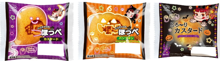
写真左より、「ペコちゃんのほっぺ(カスタード)」「ペコちゃんのほっぺ(パンプキン)」「とろーりカスタードシュー」

「ペコちゃんのほっぺ(カスタード)」「ペコちゃんのほっぺ(パンプキン)」「とろーりカスタードシュー」が期間限定でハロウィンデザインのパッケージになって登場。パッケージにスマートフォンをかざすと限定フォトフレームをプレゼント。