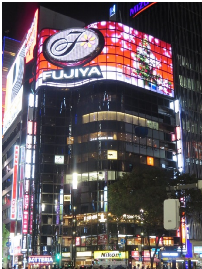
ペコちゃんビジョンクリスマスバージョン (試写の様子)

2018年3月、不二家教寄屋橋店（1953年・昭和28年開店）が入居するビル屋上の不二家広告塔を、1982年（昭和57年）以来36年ぶりにリニューアルし、「ペコちゃんビジョン」が誕生しました。映像での多様な表現が可能になり、季節に合わせてさまざまなペコちゃんが期間限定で登場しています。