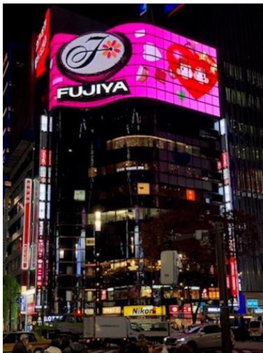
ペコちゃんビジョンバレンタインバージョン(試写の様子)

1982年(昭和57年)以来、時代の移り変わりとともに変わりゆく銀座の街を見守り続けてきた、銀座数寄屋橋交差点の広告塔「ペコちゃんビジョン」。2018年3月にリニューアルし表現の幅が広がり、季節ごとにさまざまな映像を放映してきました。