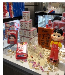
特設店 銀座三越店 (2019年10月30日 ～11月5日)

今後も旬の素材を取り入れつつ、不二家の歴史・伝統を詰め込んだ商品を提供していきます。