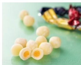
「プレミアム生ミルクィー (沖縄県産マンゴー)」※

季節やイベントに合わせてさまざまな商品を提供し、大変多くのお客様にご好評をいただいております。