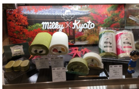
2号店 ジェイアール京都伊勢丹店

2019年9月には2号店をジェイアール京都伊勢丹にオープンし、催事では銀座三越や伊勢丹新宿店などに特設店を出店しました。