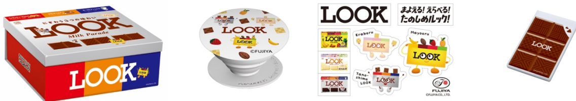
▲左から BOX、ポップソケット、ステッカー、コンパクトミラー

ルック 8 個（「ルック（ミルクパレード）」、「ルック（ア・ラ・モード）」、「ルック（ホワイトラバーズ）」各 2 個ずつ+新商品 2 個の計 8 個）に、「ルックくんフレンズ」がデザインされたポップソケット、ステッカー、チョコレートがデザインされたコンパクトミラーをセットにした「LOOK BIG BOX」。