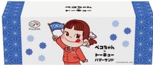
▲6 個入 (3BOX) 外箱

ペコちゃんと東京のモチーフがデザインされた BOX に、バターサンドを 2 個入れました。クリームのフレーバーは全 6 種で、フレーバーごとに BOX のイラストも異なり、選ぶのが楽しくなっちゃう一品です。本催事限定で新宿デザインの BOX も登場します。