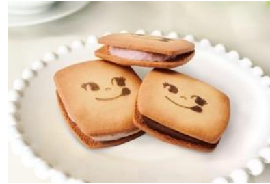
▲バターサンドイメージ

お好きな BOX を 3 つ選んで詰め合わせることができる 6 個入もあり、お土産にぴったりです。