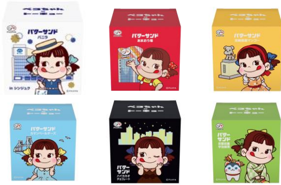
▲全 6 種類の BOX デザイン & フレーバー