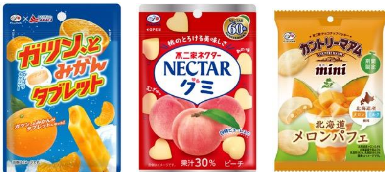
▲えらべるお菓子一例