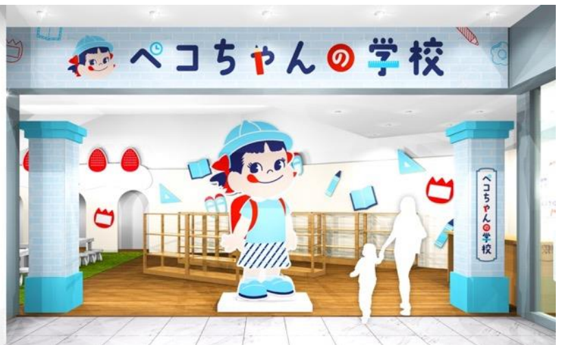
※画像はイメージです

京王百貨店 新宿店が60周年を迎えるこのタイミングで、夏休みにぴったりな、親子で楽しみながら学べるイベントを開催します。学校を題材にした不二家初のイベント「ペコちゃんの学校」を実施することで60周年を盛り上げたいと考え、京王百貨店 新宿店と不二家がタッグを組みました。