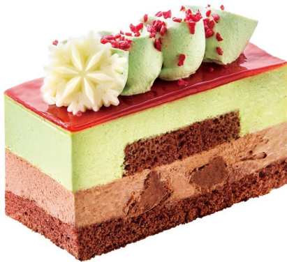
「クリスマスベリーとピスタチオショコラ」 12月1日(日)発売、税込 590円