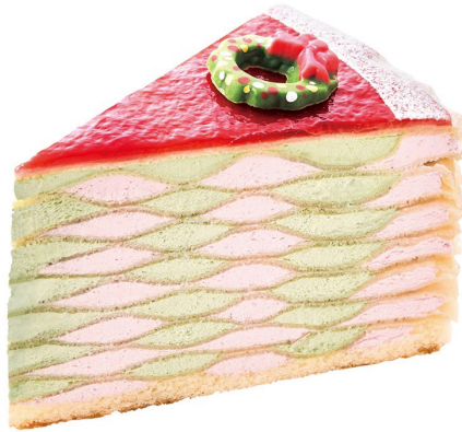
「クリスマスベリーとピスタチオのダブル ミルクレープ」 12月1日(日)発売、税込 540円