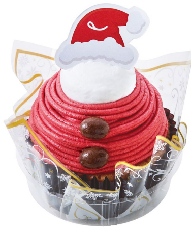
「クリスマスサンタの苺モンブラン」 12月1日(日)発売、税込 540円