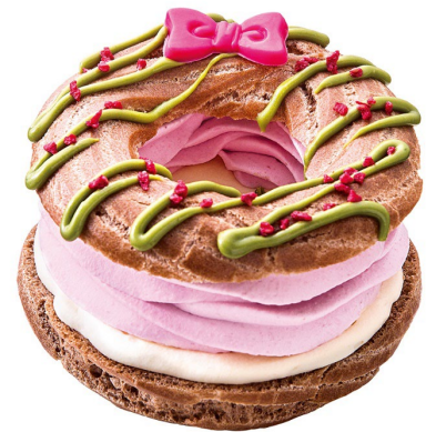
「クリスマスパリプレスト」 12月1日(日)発売、税込 420円