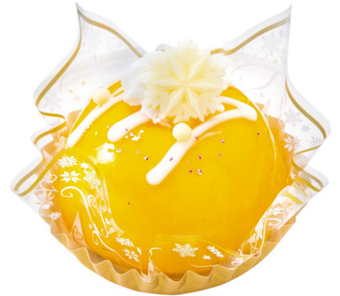
「クリスマスオーナメント(マンゴー)」 12月1日(日)発売、税込 640円