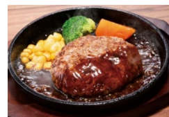
※写真は調理例です。