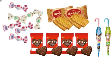
▲詰め合わせイメージ

ペコちゃん、ポコちゃん、ドッグが、イルミネーションがキラキラと輝く街中で冬を楽しむ様子が描かれた幻想的なデザインの缶に、お菓子を詰め合わせました。プレゼントとしてはもちろん、自分用にもぴったりの缶ギフトです。