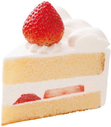
「クリスマスあまおう苺のショートケーキ」 12月20日(金)～25日(水)6日間限定発売 税込 650円

クリスマスイメージした小物ケーキも続々登場します。クリスマス限定であまおう苺を使用したショートケーキ、ベリークリームとピスタチオクリームで格子柄をデザインしたクリスマスカラーのミルクレープ、華やかな黄色のマンゴージャムで仕上げたムースケーキなど、バラエティ豊かなラインアップでクリスマスを盛り上げます。