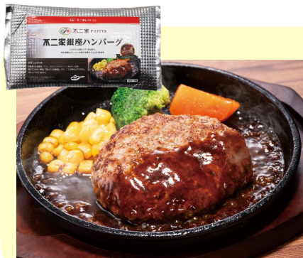
※写真は調理例です。

不二家レストランでお馴染みの「銀座ハンバーグ」がご自宅でもお楽しみいただけます！ 肉の食感とジューシーな肉汁のうまみが特長です。