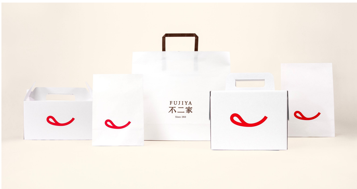
▲2023年9月にリニューアルした不二家洋菓子店の新VI

株式会社不二家（本社：東京都文京区、社長：河村 宣行）より、2023年9月に刷新した不二家洋菓子店の新VI（ビジュアルアイデンティティ）が「2024年度グッドデザイン賞」を受賞し、「グッドデザイン・ベスト100」に選出されたことをご報告いたします。