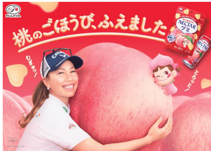
ネクターブランドの新CM『不二家ネクター／桃のごほうび、ふえました』篇より

新商品発売に合わせ、現在スポンサー契約中のプロゴルファー上田桃子選手を起用したネクターブランドの新CM『不二家ネクター／桃のごほうび、ふえました』篇(15秒、30秒)を、2025年2月4日(火)より全国でオンエア開始いたします。